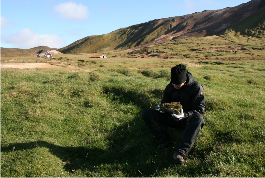
2. mynd. Skoðað undir stein í gamalli tóft á Þeistareykjum.