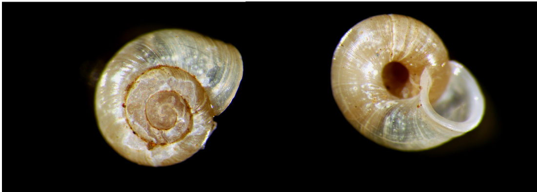
1. mynd. Snigillinn V. excentrica . Þvermál er um 2 mm.