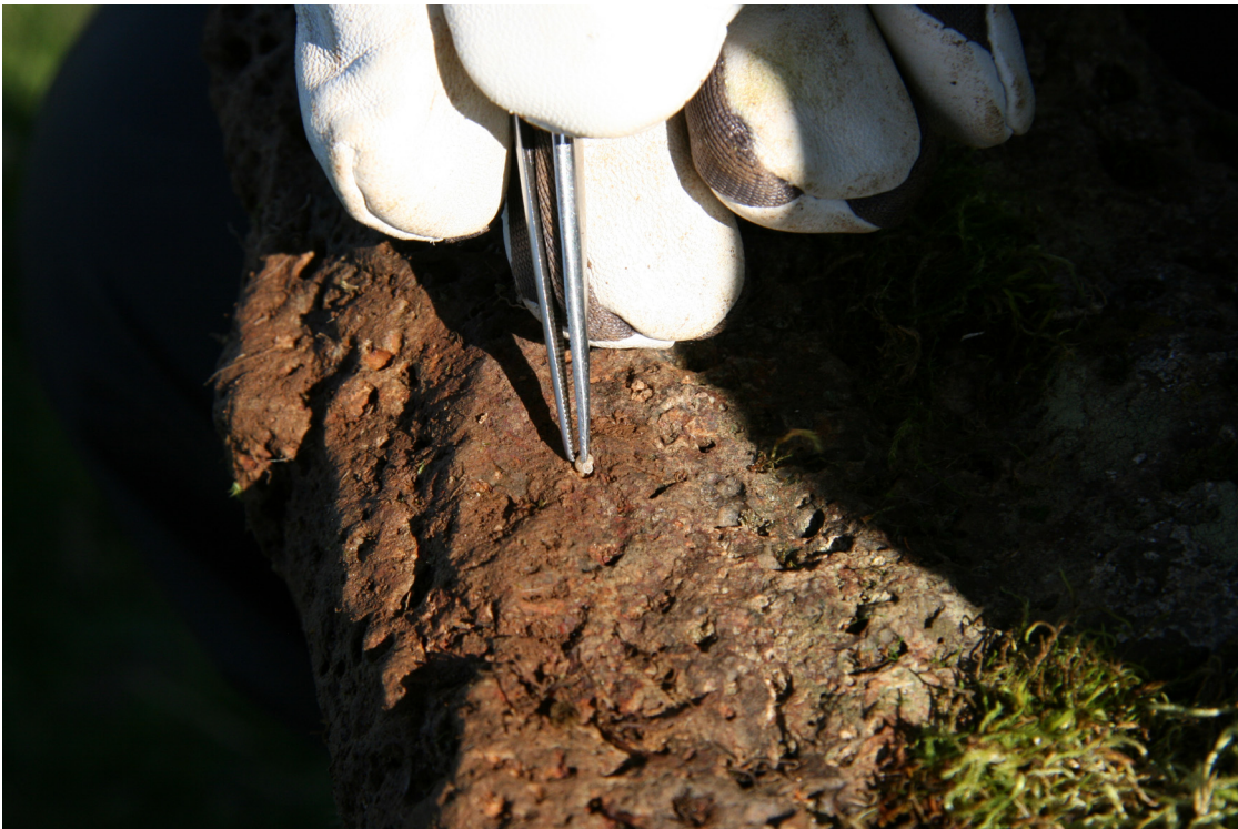
3. mynd. Snigillinn V. excentrica er smár en finnst þó auðveldlega þar sem hann er vegna þess hversu áberandi ljós hann er yfirlitum.